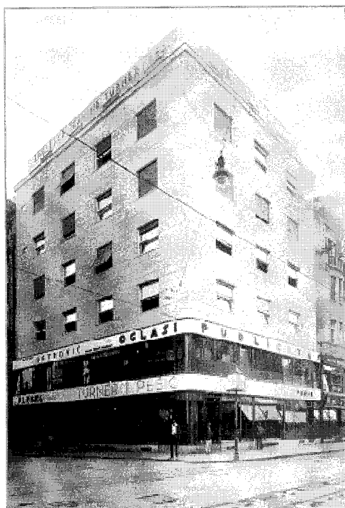
Сл. 2 Стамбено трговачка кућа, Илица бр. 9, Загреб 1929-30. Residential and business building, Ilica 9, Zagreb 1929-30.

Епидемиолошки завод у Загребу. У том периоду је пројектовао и руководио градњом поште у Сиску, као и надградњом главне поште у Загребу. Године 1929. стиже звање овлашћеног архитекта и отвара самостални архитектонски атеље у Загребу.