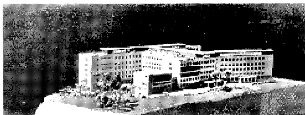
Сл. 5 Гинеколошко акушерска клиника, Београд 1948-1956. Gynaecology and obstetrics clinic in Belgrade 1948-1956.

године, обе реализоване у Загребу; болница у Сиску (1930); болница у Сушаку (1931); болница на Ребру у Загребу (1934-1941) итд.