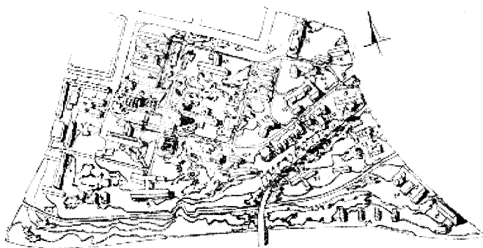
1. Хируршки Блок 2. интерна Клика 3. гинекологичка 4. државна шко за физиотерапију Београд 5. стоматолошко-хируршка клиника 6. урбанистички пројекат 7. вештачки језеро 8. институт 9. лабораторија 10. институт 11. државна ветеринарска 12. вештачки језеро 13. клиника за гинекологичку хирургију 14. клиника за гинекологичку хирургију 15. клиника за гинекологичку хирургију 16. клиника за гинекологичку хирургију 17. клиника за гинекологичку хирургију 18. клиника за гинекологичку хирургију 19. клиника за гинекологичку хирургију 20. клиника за гинекологичку хирургију 21. клиника за гинекологичку хирургију 22. клиника за гинекологичку хирургију 23. клиника за гинекологичку хирургију 24. клиника за гинекологичку хирургију 25. клиника за гинекологичку хирургију 26. клиника за гинекологичку хирургију