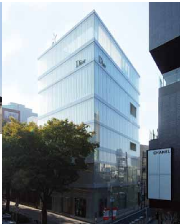
Сл.12. Управна зграда Диор-а, Токио (Сеџима & Нишизава) Fig.12. Dior building, Tokyo (Sejima & Nishizawa)