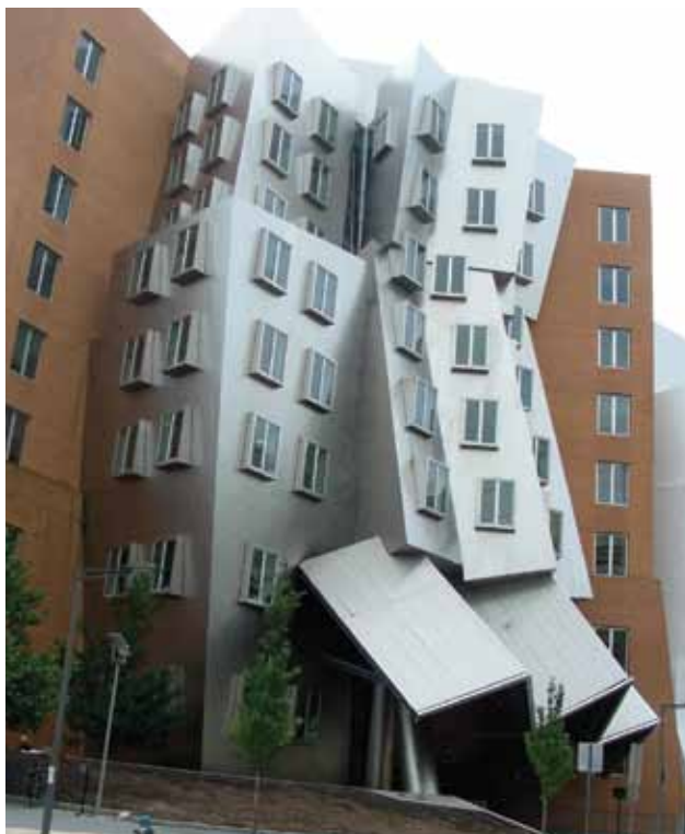
Сл. 9. Стата центар, МИТ (Ф. Гери) Fig. 9. Stata center, MIT (F. Gehry)

http://www.flickr.com/photos/atelier79033/2769238162/