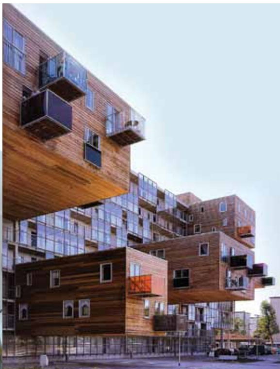
Сл. 10. “Wozoco” апартмани, Амстердам (МВРДВ) Fig. 10. Wozoco apartments, Amsterdam (MVRDV)

Сангвиничан израз је весео, умерен и оптимистичан (сл. 10), у првом плану је живахност и разиграност облика и простора ( Хрњица , 1994). Испољавање енергије је контролисано, са повременим акцентирањем које може бити афективне природе. Екстрвертност је природна тенденција којом се објекат отвара према околини и води дијалог са њом. Неке од главних одлика овог израза су исказивање