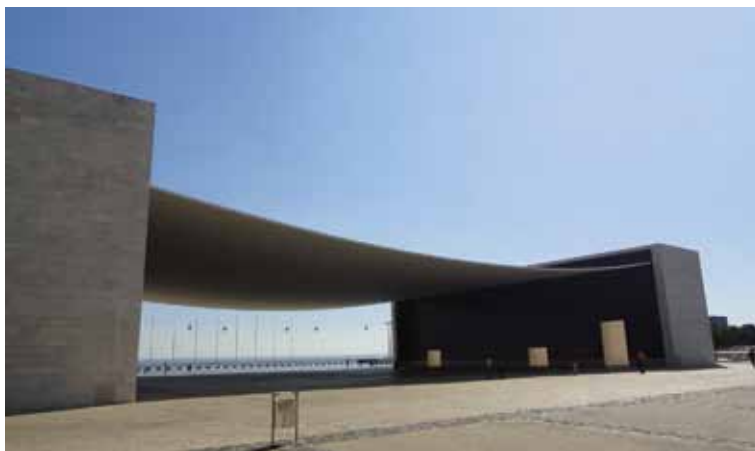
Сл.11. Португалски павиљон, Лисабон (А. Сиза) Fig.11. Portugal pavilion, Lisbon (A. Siza) http://www.mimoo.eu/projects/Portugal/Lisbon/Pavilion%20of%20Portugal