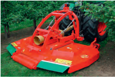
Slika 3. Rotaciona kosačica