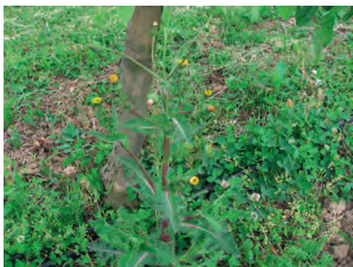
Slika 1. Korovi u voćnjaku, Sonchus oleraceus i dr. vrste

Zbog svega navedenog, kao i činjenice da su korovi često prelazni domaćini biljnim štetočinama i patogenima, proizvođači jabuka posvećuju dosta pažnje uklanjanju korova sa ovih površina. Najefikasnija i ujedno najčešća direktna mera je primena herbicida na bazi više aktivnih supstanci kao što su: napropamid, glifosat, 2,4-D, flazasulfuron, fluorloridon, cikloksidim, fluazifop-p-butil, kletodim, dikvat, fluoksipir-meptil, piraf্লufen-etil i dr. Kod odabira aktivnih supstanci potrebno je povesti računa o: 1) kvalitetu i sastavu zemljišta, 2) mogućnostima razvoja rezistentnosti korova na herbicide (zbog smanjene mogućnosti rotacije mehanizma delovanja herbicida), 3) efikasnijem suzbijanju jednogodišnjih korovskih vrsta čime se favorizuje širenje višegodišnjih vrsta i 4) zanošenju (driftu) herbicida na lisnu površinu jabuke. Osim toga, preporučuje se korišćenje prskalica sa diznama lepezastog mlaza (kapljice većeg prečnika) koje imaju štitnike, a da primena bude po mirnom (nevetrovitom) vremenu i temperaturama ispod 25°C (Slika 2).