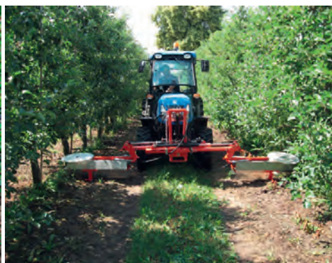
Slika 2. Primena herbicida u voćnjaku

Najbolji efekat se postiže kombinacijom zemljišnih i folijarnih herbicida uz čestu promenu mehanizma delovanja aktivne supstance. U tabeli 3 prikazani su rezultati biološke efikasnosti različitih količina primene herbicida na bazi tri aktivne supstance (piraf্লufen-etil, oksifluorfen, glifosat) u suzbijanju korova u zasadu jabuke na četiri lokaliteta.