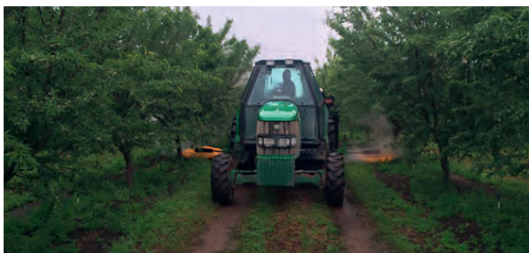
Slika 6. Termičko uništavanje korova (www.weedtechnics.com)