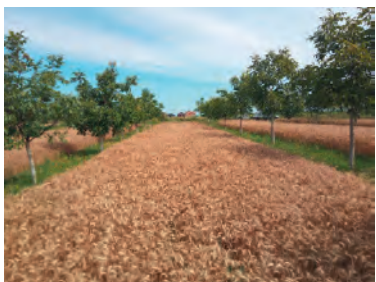
Slika 5. Gajenje pokrovnih useva u višegodišnjim zasadima