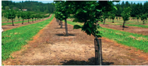
Slika 4. Malč od pepela u voćnjaku