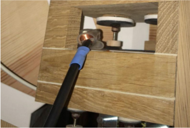
Example 1: J. Veličković, Underneath , position of the coils