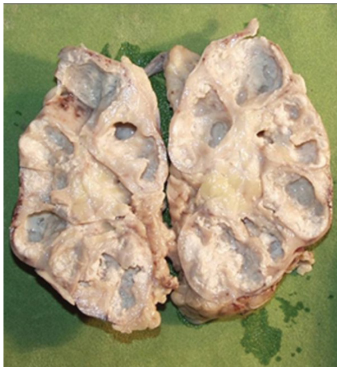
Slika 1. Preparat terminalno izmenjenog (engl. end stage ) tuberkuloznog bubrega (7)

Kultura mokraćne je senzitivna u 80% do 90% slučajeva i ima specifičnost od skoro 100% (13). I pored toga, potrebno je duže vreme do dobijanja rezultata (i do 6 ne-