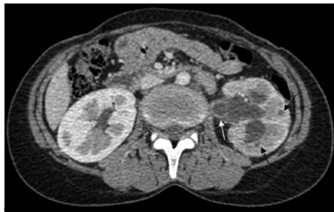
Slika 3. Kompjuterizovana tomografija prikazuje granulome u parenhimu (crne strelice), kalijektazije i ureterektazije praćene zadebljanjem urotela (bele strelice) (15)

Ova metoda se koristi i za određivanje stepena hidronefroze, identifikovanje ožiljaka u bubregu, patoloških masa i zadebljanja urotela, što se može sresti kod TBC bubrega (15) (slika 3).