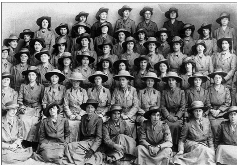
Слика 4. Болнице шкотских жена, Јединица „Америка“, у Острову, на Солунском фронту Figure 4. The Scottish Women's Hospitals, America Unit, Ostrovo, Salonika Front