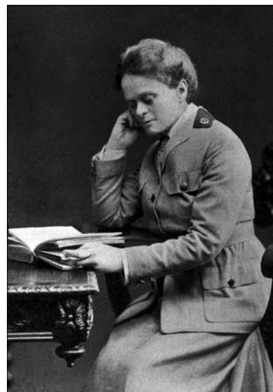
Слика 8. Др Елси Мод Инглис (1864–1917) године 1916.

Figure 7. Dr. Isabel Emslie, CMO of the Scottish Women's Hospitals in Vranje