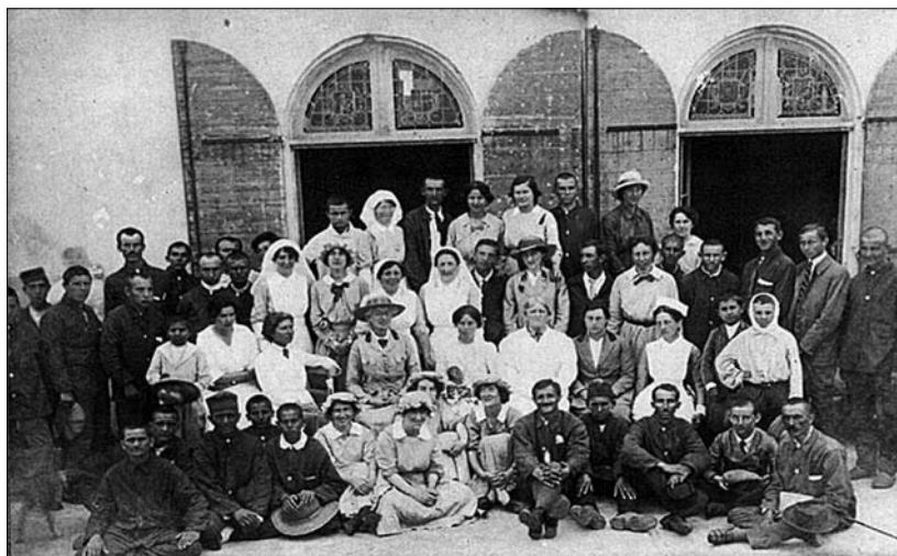
Слика 3. Болнице шкотских жена, Јединица „Корзика“, Ајачо, Корзика Figure 3. The Scottish Women's Hospitals, Corsica Unit, Ajaccio, Corsica

Јединица „Гиртон и Њунам“ у Солуну била је у саставу француског санитета, са наменом појачања српског војног санитета на Солунском фронту. Само у периоду јул–август 1916. болница је примила 1000 пацијената, а најчешће са дијагнозом маларије и дизентерије. Након Горничевске и Кајмакчаланске битке, велику улогу у хируршком збрињавању имале су јединице Болница шкотских жена у Солуну и Острову. Је-