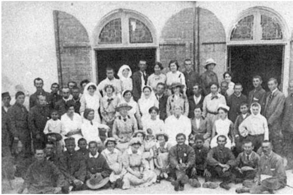
Слика 2. Особље и болесници Болнице шкотских жена у Ајачу, на Корзици.

Figure 2. The staff and patients of the Scottish Women's Hospital in Ajaccio, Corsica