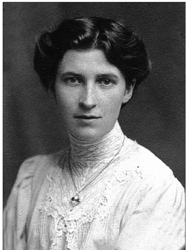
Слика 4. Франческа Мери Вилсон (1888–1981)

У послератном периоду Франческа Вилсон је посетила Србију, била у Београду, у Нишу и другим градовима, у циљу ширења хуманитарне помоћи расељеним лицима и рањеним војницима, повратницима из рата. О својим искуствима са Србима у изгнанству и у Србији у време Првог светског рата написала је књиге „Портрети и слике из Србије“ ( The Portraits and