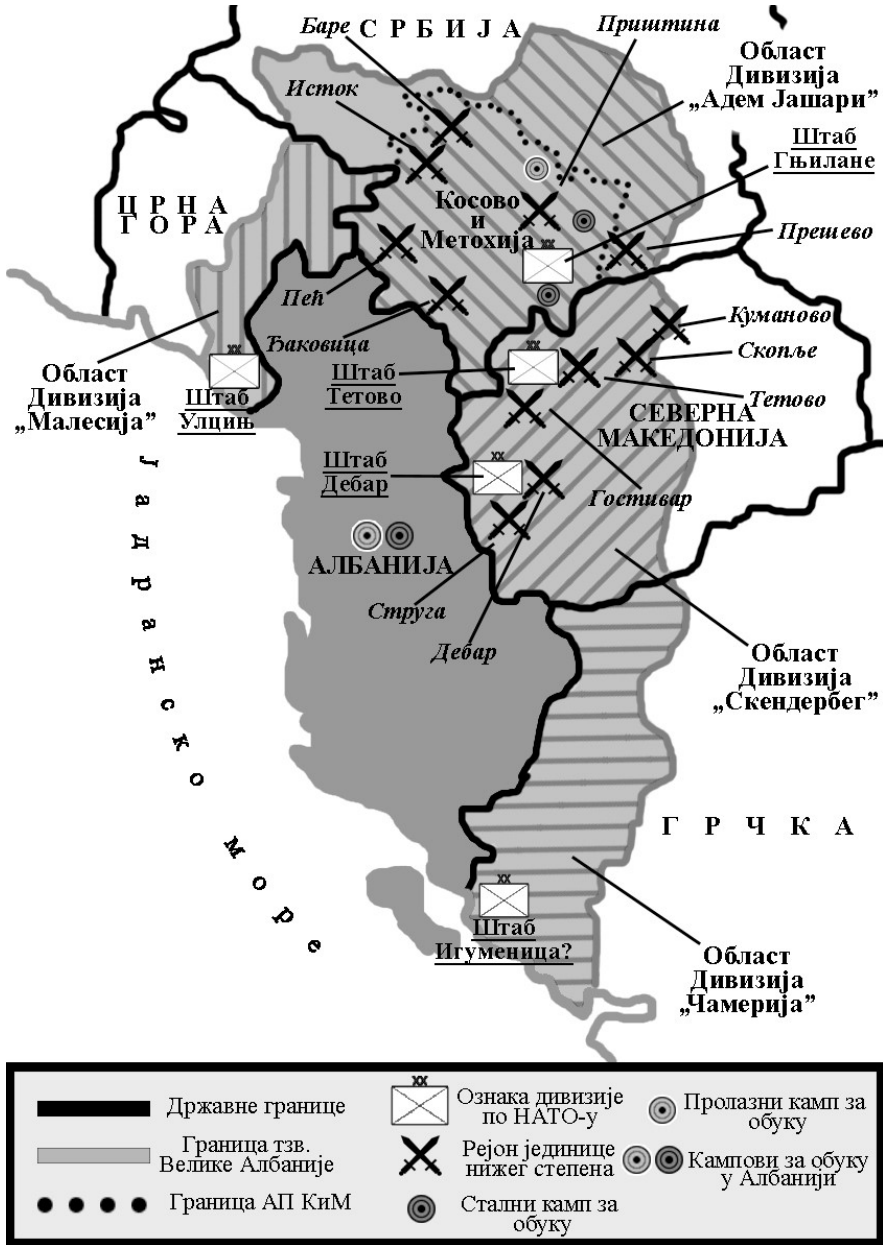
Слика 1: Распоред јединица терористичке АНА