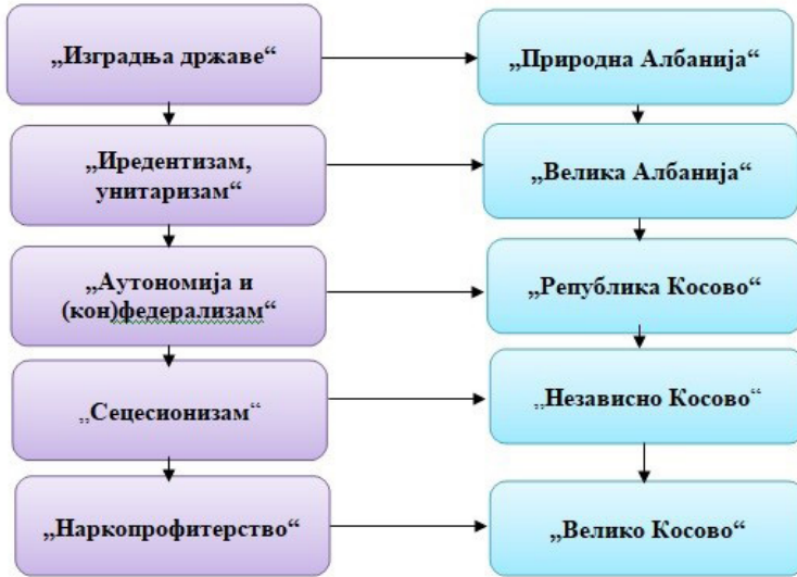
Графикон 1: Развој иредентистичке идеологије албанских екстремиста на Косову и Метохији (Аутори)

Након што су се српске војне снаге повукле са Космета, НАТО је преузео контролу над простором. Косово је остало под заштитом УН од 1999. до његовог једностраног проглашења независности 2008. године (Hall, 2014: 362). Иако је изгледало да је тероризму дошао крај, ове снаге безбедности, под патронатом САД, Немачке и Британије, успоставиле су контакте с вођама терориста. Пошто је према Резолуцији 1244 договорено да се терористичка тзв. Ослободилачка Војска Косова – ОВК демилитаризује, ове „мировне“ снаге не само да су прекршиле договор већ су отворено стале на страну терориста, а самим тим успоставиле окупаторски систем. Од тог момента ОВК почиње своју трансформацију. Пројектом је предвиђена трансформација ОВК у политичке партије, стварање косовске полицијске службе и језгра косовских оружаних снага по узору на америчку Националну гарду. Припадници ОВК који не постану део нове структуре, наставили би да се баве предратним активношћима, што би заправо значило да ће бити носиоци организованог криминала и насиља под заштитом НАТО структура. Званичници КФОР-а су, међутим заузели став да се уместо језгра оружаних снага формира „Косовски заштитни корпус (КЗК)“, око чега је било много спорења у преговорима (Дреџун, 2016: 149)