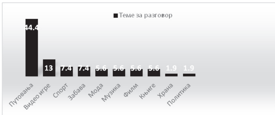
Графикон 3. Теме за разговор