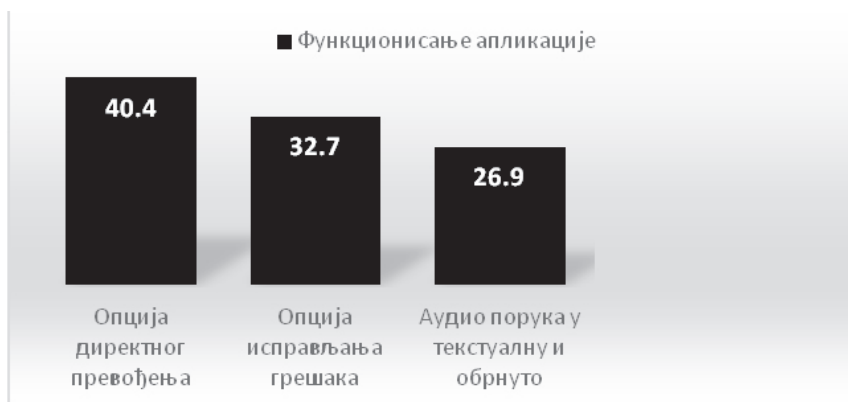
Графикон 4. Функционисање апликације – најкорисније опције

Када је реч о функционисању апликације HelloTalk , опција директног превођења је од највећег значаја за 40,4% студената, посебно уколико је реч о почетним нивоима учења језика (A1–A2). Опцију исправљања евентуалних грешака у самој поруци, односно аутоматско добијање повратне информације од стране софтвера, 32,7% испитаника перципира као најважнију. Опција директног пребацивања аудио поруке у текстуалну и обрнуто најкориснија је према мишљењу 26,9% испитаника. По мишљењу учесника фокус групе, оно што ову апликацију издваја од осталих је то што је разумљива и лака за коришћење, што постоји више нивоа знања и што се путем ове апликације може усавршавати више страних језика. Испитаници виде бројне позитивне стране ове мобилне апликације, а оно чиме су посебно задовољни јесте брзина повратне информације, одмах се указује на уочену грешку и предлаже адекватно решење – по чему се апликација HelloTalk разликује од осталих.