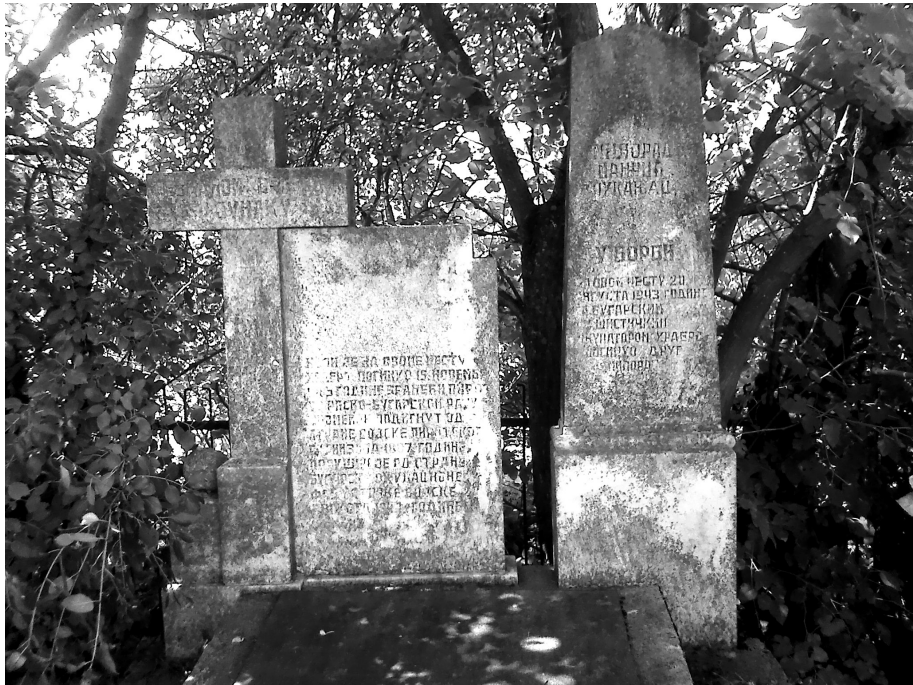
Слика 1 Спомен-обележја на Ћелташу код Пирота Figure 1 Monuments on Ćeltaš near Pirot

мемоарима учесника Пиротске битке 1885. Таквог српског војника, на пример, не помиње у својим објављеним успоменама ни мајор Светозар Магдаленић, командант V пешадијског пука Дринске дивизије српске војске, иако је током битке за Пирот неко време био баш и на Ћелташу (Магдаленић, 1911, стр. 14). Живојин Мишић, будући војвода, а у рату 1885. поручник из састава поменутог Магдаленићевог пука, у својим успоменама такође не помиње никаквог српског јунака са Ћелташа, иако догађаје на тој локацији описује знатно опширније него Магдаленић (Мишић, 1985, стр. 134-138).