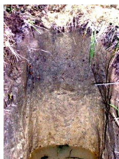
A_{oh}E_g - B_{tNa} -CG