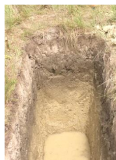
A_{oh}E_g - B_{tNa} -CG