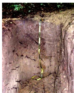
A_{mo} - C_{ca} -CG

CG (60 – 110 cm): prljavožuti les sa karbonatima