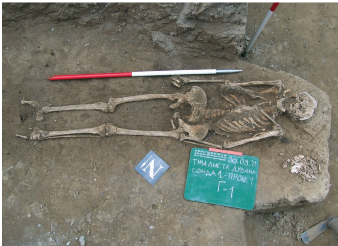
Сл. 4. Сонда 1, остаци гроба Г-1 (G-289)

Инхумација је обављана полагањем покојника у обичну гробну јаму, зидани гроб од опека, камена или секундарно употребљених камених плоча и стела или полагањем у камене или оловне саркофаге. Приметно је, такође, да је сахрањивање у зиданим гробовима од опека заступљеније на простору око бивше савезне скупштине, на платоу испред Скупштине града Београда и даље према Крунској и Лазаревићевој улици, док је највећа концентрација етажних гробова спаљених покојника на простору од Косовске 39, према Палмотићевој, Влајковићевој, Таковској улици и простору парка Ташмајдан.