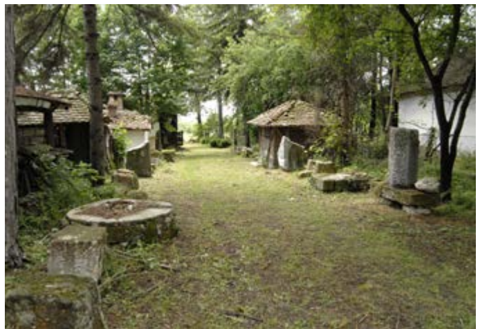
Сл. 6 / Стаза са вајалима и скулптурама