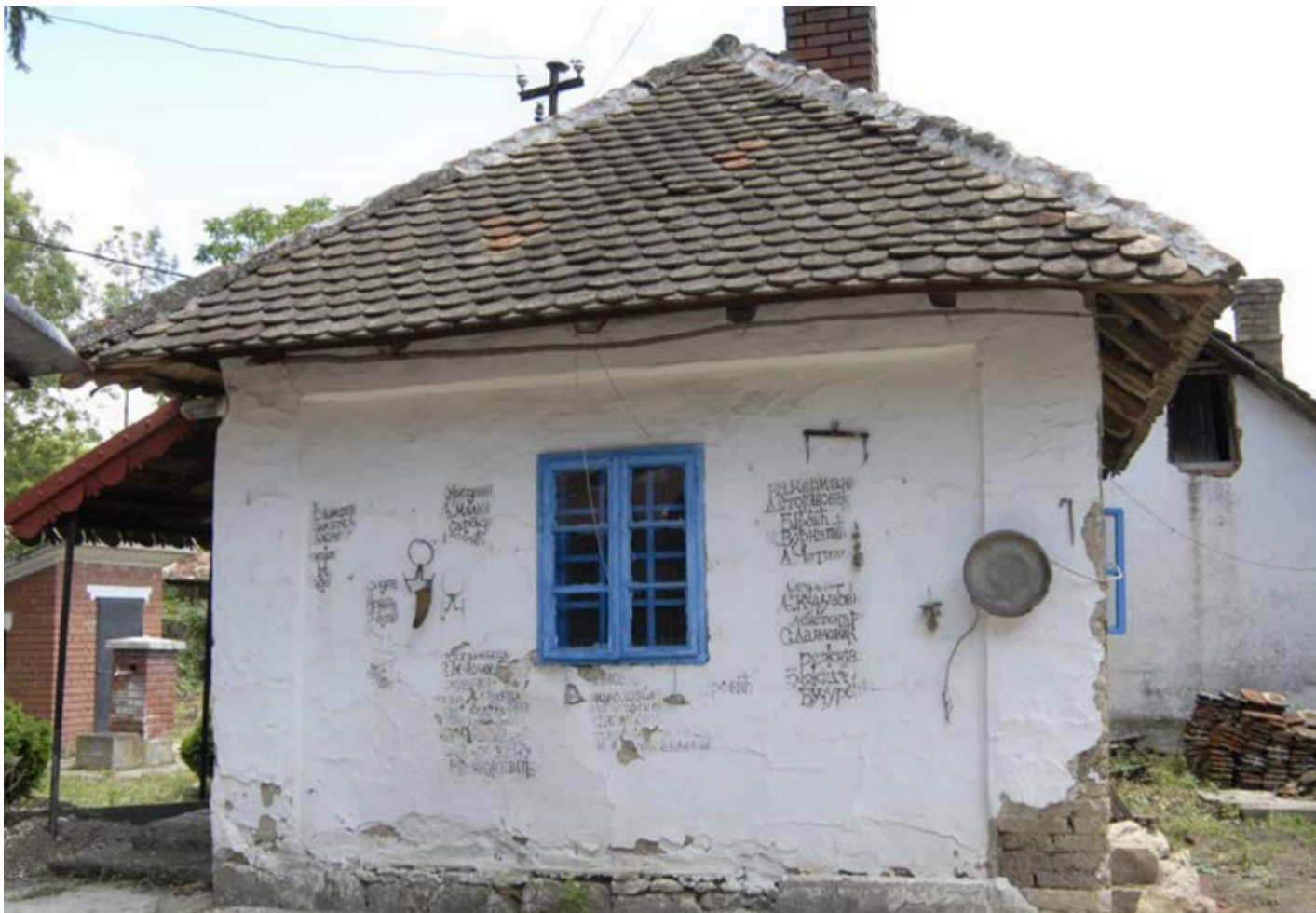
Сл. 3 / Родна кућа – одјавна шпица за емисију о уметнику

бар, сушара, две хлебне пећи, два млекара, вајат, трпезарија на отвореном, чесма и бунар, камена композиција за седење.