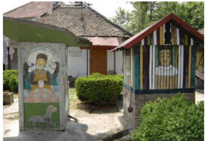
Сл. 5 / Чесма и бунар