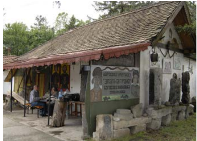
Сл. 2 / Улаз у комплекс