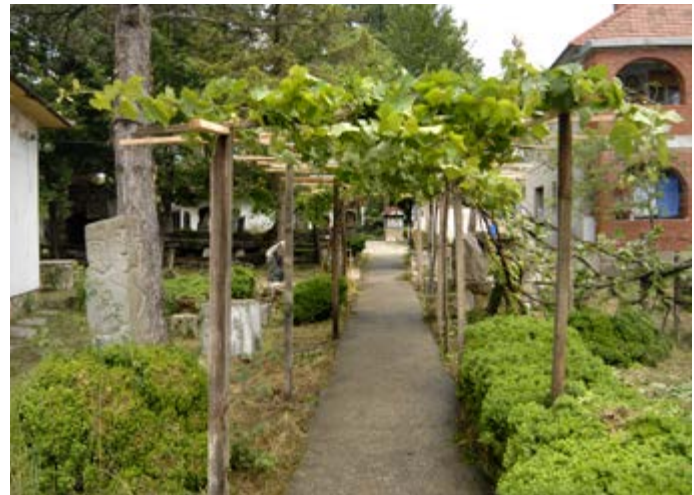
Сл. 4 / Главна стаза са кућом за становање у џозадини

Он има меморијалну вредност као родна кућа једног од највећих наивних уметника Србије. Посебна ауторска вредност се огледа у чињеници да се у оквиру споменика културе, како на отвореном простору тако и у ентеријеру, налази велика уметничка збирка Богосава Живковића, у којој су и нека од његових највреднијих дела. Као сведочанство припадности елитном уметничком простору, у време сложених кретања на ликовној сцени ондашње Југославије и света – од фигуративности до апстрактног израза, од експресионизма преко енформела до фантастике и надреал-