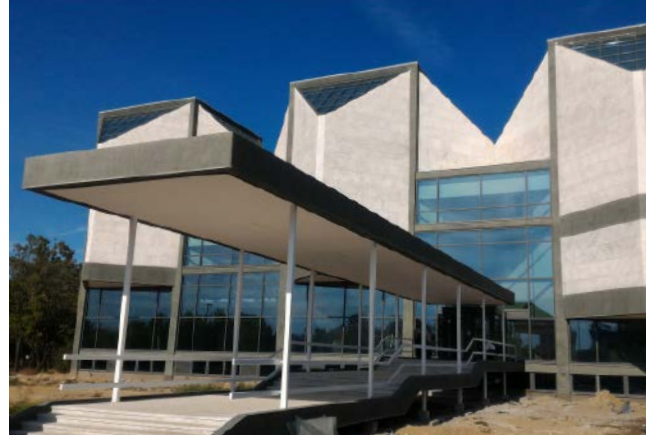
Сл. 7а, 7б / Реконструкција Музеја савремене уметности (ЗЗСКГБ)