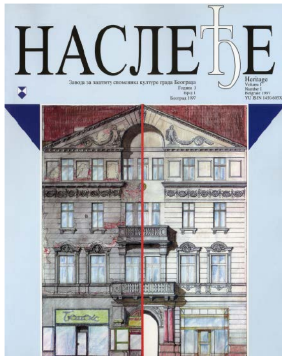
Сл. 1 / Насловна слика првог броја 'Наслеђа'

је заштита веома широк појам, то пружа велике могућности запосленима у Заводу да иницирају читав низ активности које далеко надмашују пуку бригу о физичком одржавању културног наслеђа, па су их они веома успешно разгранали последњих двадесет година.