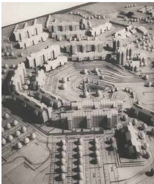
Сл. 3 / Македонија насеља Церак виногради, утврђене просјорне културно-историјске целине (ЗЗСКГБ)

слику и начин живота. Показало се да је тако преобразено наслеђе врло привлачно како за грађане тако и за туристе. Поједине грађевине и целине су веома дуго и свестрано истраживане, па су, зато, проглашаване споменицима културе у групама, у зависности у којим годинама су коначно биле обрађене. 3 Проглашавање споменика културе и просторних културно-историјских целина од изузетног значаја углавном је обављено седамдесетих и осамдесетих година XX века, јер су њихове карактеристике релативно лако могле да се вреднују по више основа, а требало их је и заштитити од убрзане урбанизације централних градских зона. У последњих двадесет година нису регистровани споменици културе ни целине од изузетног значаја. Највећи број уписаних у регистар припада категорији споменика културе, врло разноврсне типологије функција и архитектонске структуре. Заступљеност по општинама јасно указује на начин ширења градске територије којом су обухватана села и насеља са руралном архитектуром, сачињеном од материјала који брже пропада. То су, истовремено и делови града