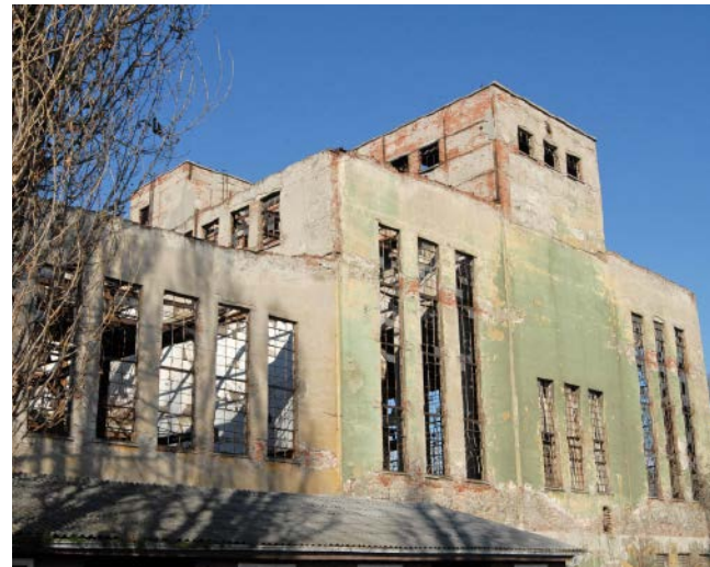
Сл. 2 / Споменик културе Термоелектрана 'Снага и светлост' (ЗЗСКГБ)

Поједине делатности већ су, као што је поминуто, у претходном периоду методолошки биле добро дефинисане и у последње две деценије су само усклађиване с разним новијим међународним и националним теоријским ставовима о културном наслеђу, новим технологијама и материјалима. Напредак је посебно уочљив у дигитализацији читавог низа послова, што је активности Завода учинило транспарентним и доступним другим стручњацима и јавности. Сајт Завода, који се врло уредно ажурира, прегледан је и садржи већину информација помоћу којих се може и критички процењивати напредовање градске службе заштите из године у годину. 2