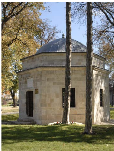
Сл. 8 / Дамад Али-пашино џурбе на Горњем брду Београдске тврђаве (ЗЗСКГБ)

ци Завода сарађивали су с Турском агенцијом за међународни развој и сарадњу – ТИКА (Türk İşbirliği ve Koordinasyon Ajansı Başkanlığı – ТИКА), на реализацији идејног пројекта реконструкције и рестаурације Турбета Дамад Али-паше на Београдској тврђави, затим на пројекти реконструкције, рестаурације и презентације Чесме Мехмед-паше Соколовића на Београдској тврђави и, коначно, на извођењу реконструкције и рестаурације Малог степеништа на Београдској тврђави. То су свакако први кораци у остваривању дугорочније сарадње током које ће се одређени конзерваторски ставови искуствено усавршавати и давати боље резултате. Споменик захвалности Француској , један од репера у Калемегданском парку, рад вајара Ивана Мештровића, захтевао је доста припрема за санацију и рестаурацију, па је успостављена сарадња с Рестаураторским заводом Хрватске у Загребу, а затим, 2017. године и сарадња с Амбасадом Француске и Удружењем за неговање културе сећања „ Le souvenir Français “, поводом обележавања годишњице завршетка Првог светског рата.