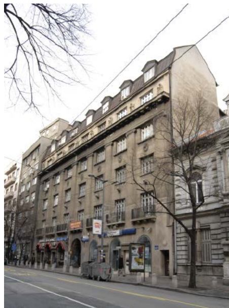
Сл. 6 / Дом Савеза набављачких задруга државних службеника у Београду, Македонска 21, споменик културе утврђен 2018. године (ЗЗСКГБ)

чаја и 353 су културна добра. Претходну заштиту уживају 122 објекта, 22 целине и осам споменика. У овом изношењу података треба још нагласити да је рад на непокретним културним добрима у великој мери отежан применом Закона о културним добрима, који је првобитно усвојен 1992. године, а допуњен 1994. Поједини чланови тог закона одавно су превазиђени и неусклађени с међународно прихваћеним принципима конзервације, као и са домаћим законима, нарочито Законом о планирању и изградњи, који је последњи пут ажуриран недавно, почетком 2019. године. Спорост у дефинисању и усвајању новог закона у области заштите веома је штетна и јасно се уочавају ограничавајуће, конзервативне ставке постојећег закона, што свакако штети раду на непокретним културним добрима.