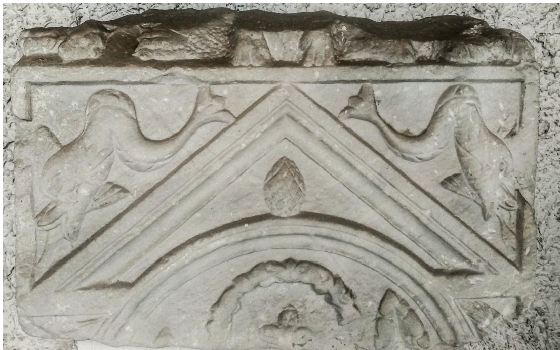
Сл. 3. Фрагмент стеле с круништем из Смедерева

града, такву претпоставку би требало узети с резервом, уз наду да ће будућа археолошка истраживања допринети свеобухватнијем сагледавању ове теме.