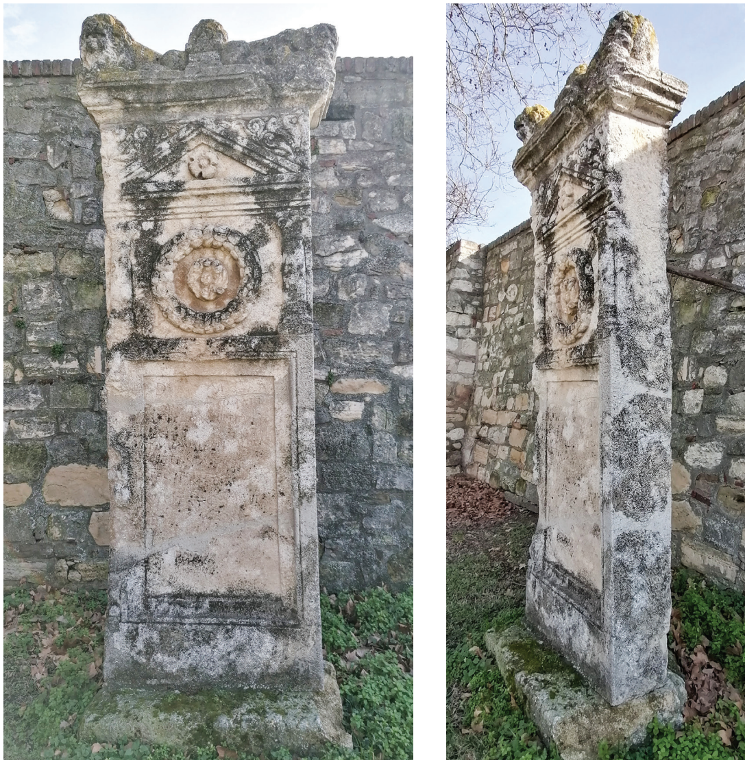
Сл. 1, 1а. Сџела Марка Аурелија Биџа из Палмоџићеве улице

изнад етажног гроба једног кремираног покојника. Скулптура и профилисани венца су исклесани из једног дела камена. Са доње стране венца могу се и данас уочити остаци гвозденог клина заливеденог оловом. Такође, на глави лава је сачувано једно мање удубљење с остацима олова и отиском клина који данас недостаје. Иконографија представе, као и остаци гвозденог клина заливеденог оловом са доње стране венца, несумњиво указују на то да се ради о десном делу круништа једне стеле.