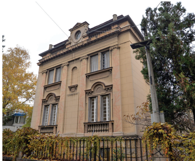
Сл. 8. Војводе Драјомира 23

ређеног стила живота њених житеља. Прописане мере заштите чувају све оне елементе простора који га чине вредним и унапређују културно- историјске, архитектонско-урбанистичке, амбијенталне, стилске, естетске и природне вредности просторне културно-историјске целине. Очување карактера простора и затечене историјске урбане матрице, као што је ивична блоковска изградња по ободу целине, дуж уличних потеза Максима Горког, Милешевске и Каленићеве улице, али и очување изградње на повученој регулацији, с предбаштама, дуж уличних потеза Тополске, Петроградске, Новопазарске и Војводе Драгомира, трајно ће заштитити дух овог простора, на некадашњој периферији Београда. Поштовањем затеченог принципа урбанистичког и архитектонског артикулисања простора, који подразумева вишеспратне стамбене објекте по ободу и објекте с предбаштом и баштом унутар целине, очување амбијент Крунског венца као мирне стамбене зоне, што је изворно и био. Подразумева се задржавање преовлађујуће изграђености, хоризонталне и вертикалне регулације дуж уличних потеза Милешевске, Каленићеве и улице Максима Горког, као и заштита и очување вреднованог грађевинског фонда и његових стилских и типолошких карактеристика.