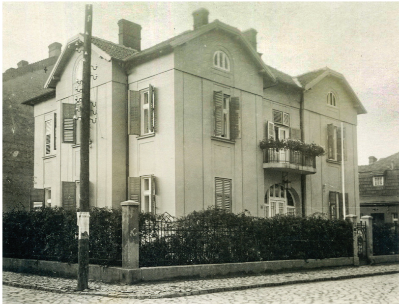
Сл. 3. Угао Петроградске и Тополске