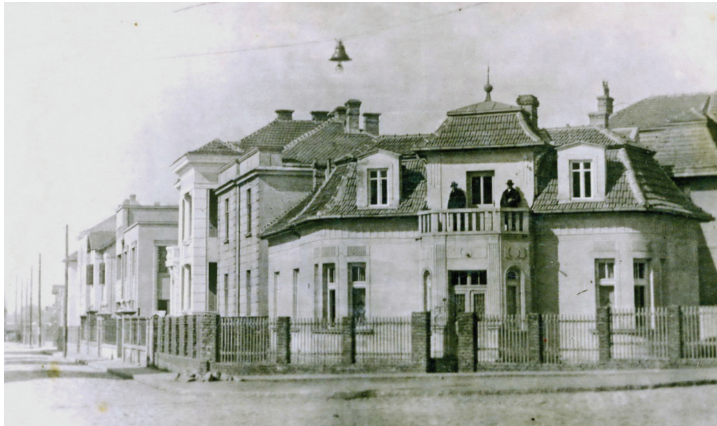
Сл. 2. Улаз Тойолске и Војводе Драјомира

20. века, потез Крунске улице добија репрезентативан карактер, који ће се касније све више развијати и задржати све до наших дана.