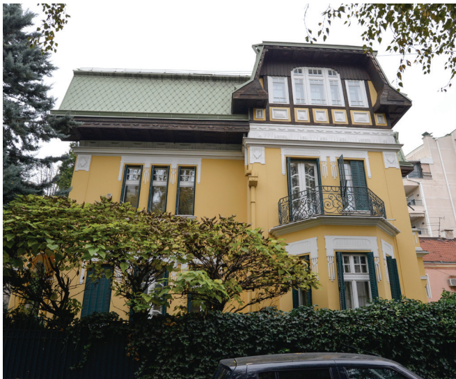
Сл. 7. Војводе Драјомира 16

ређеног стила живота њених житеља. Прописане мере заштите чувају све оне елементе простора који га чине вредним и унапређују културно- историјске, архитектонско-урбанистичке, амбијенталне, стилске, естетске и природне вредности просторне културно-историјске целине. Очување карактера простора и затечене историјске урбане матрице, као што је ивична блоковска изградња по ободу целине, дуж уличних потеза Максима Горког, Милешевске и Каленићеве улице, али и очување изградње на повученој регулацији, с предбаштама, дуж уличних потеза Тополске, Петроградске, Новопазарске и Војводе Драгомира, трајно ће заштитити дух овог простора, на некадашњој периферији Београда. Поштовањем затеченог принципа урбанистичког и архитектонског артикулисања простора, који подразумева вишеспратне стамбене објекте по ободу и објекте с предбаштом и баштом унутар целине, очување амбијент Крунског венца као мирне стамбене зоне, што је изворно и био. Подразумева се задржавање преовлађујуће изграђености, хоризонталне и вертикалне регулације дуж уличних потеза Милешевске, Каленићеве и улице Максима Горког, као и заштита и очување вреднованог грађевинског фонда и његових стилских и типолошких карактеристика.