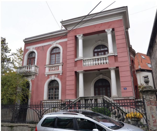
Сл. 4. Тойолска 19