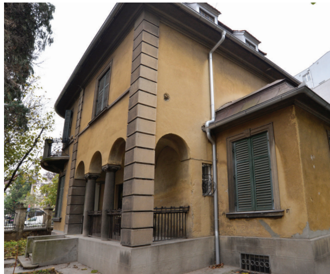
Сл. 5. Тойолска 24

гомира. После Другог светског рата, део простора (улични потез Милешевске улице) претрпео је радикалну реконструкцију изградњом објекта већег габарита са више улаза, чиме је поништена постојећа парцелација, као и традиционални систем блоковске изградње.