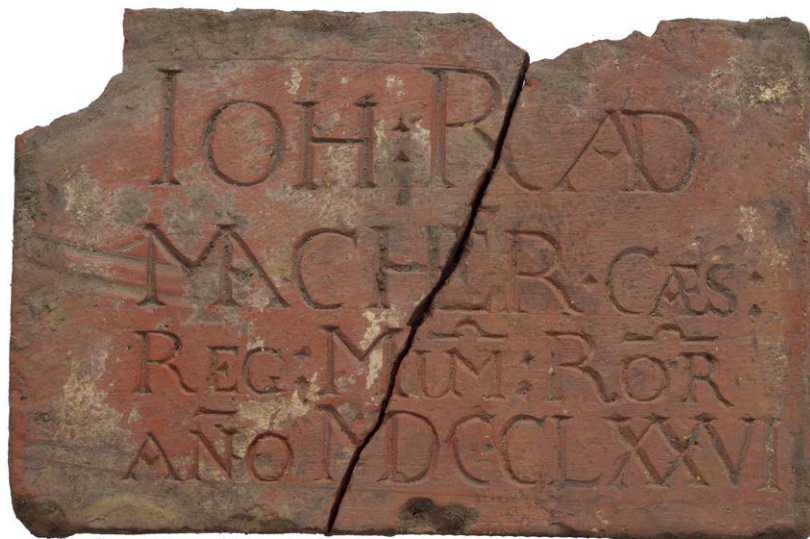
Сл. 2. Табла с латинским исписом из Главне (данашњи број 15), 2023.