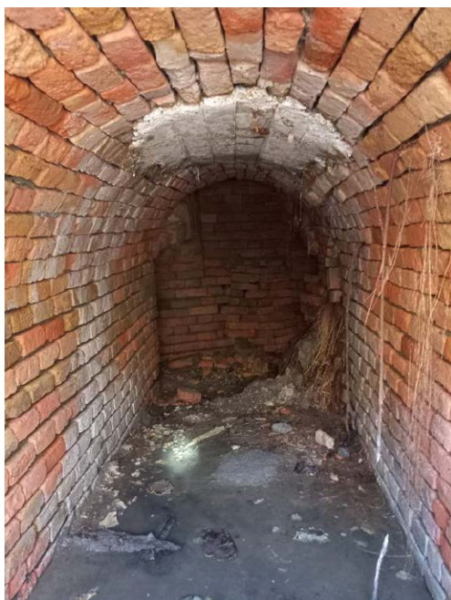
Сл. 7. Остаци канала колектора, Главна улица, 19. век

fiaker sjesti i prevesti se. Prije 1880. godine nije pak bilo ni fiakera, pa je moralo kadkad i po sat čekati dok se voda odlila. 14