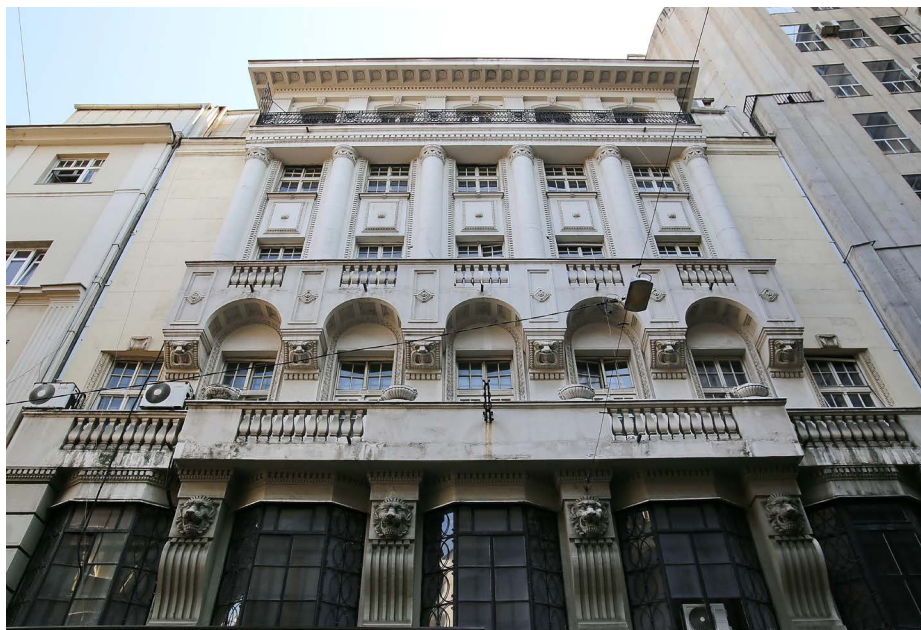
Сл. 9. Есконтна банка, излeг прочeља

оживљавају декоративни рељефи. На свим нивоима правоугаони прозорски отвори су двокрилни, док на првом имају и надсветло, које повећава ваздушни и светлосни унутрашњи комфор.