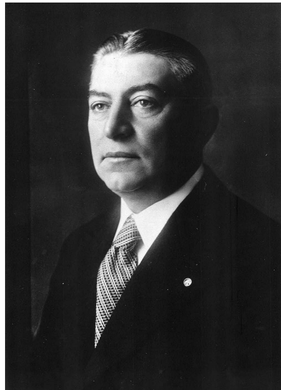
Сл. 1. Архитекта Драгиша Брашован

Брашованов начин уклапања је увек активан и градотворан, усклађен с архитектонским окружењем и рељефом – никада отуђен, поједностављен и недоречен. Као еkleктичар и модернист, упорно је радио по својој , не прихватајући стандардизацију архитектонског језика, због чега су му