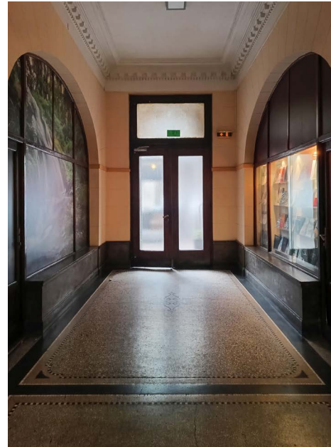
Сл. 8. Палаћа Индустријске коморе и Удружења београдских индустријалаца, ходник приземља

у архитектури и скулптури. Облога фасаде од вештачког камена у браон боји естетски је усаглашена са застакљеним површинама, увученим у зидну масу. Армиранобетонска конструкција је згради донела чврстину, омогућивши јој дубок продор у парцелу на благо закошеном терену.