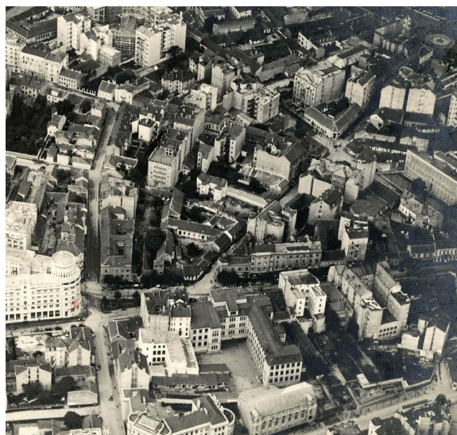
Сл. 6. Авионски снимак центра Београда (1933), њојшоручника Лазаревића

Палата индустријских организација садржи разуђену основу налик на ћирилично слово „П“, с централним постројењем и бочним крилима између којих се налази слободан простор ограђен са три стране, с терасом на првом спрату који унутрашњости објекта обезбеђује примаран ваздушни и светлосни комфор. (сл. 6) Тротрактни план етажа задовољио је потребе за различитим функцијама објекта велике квадратуре, при чему су примарне просторије оријентисане према уличној страни, остајући само с једним извором природног осветљења. Подужни коридор са заобљеним пролазима у приземљу с просторијама Индустијске банке и свечана сала за састанке, конференције, забаве и предавања (одвојена од читаонице и гардеробе ступцима), на првом спрату на којем су се налазиле просторије Удружења Београдских индустријалаца (са клупским просторима и бифеом у позадини), представљају најсвечаније пунктове ентеријера репрезентативног здања. (сл. 7–8) Други спрат је резервисан за просторије Индустијске Коморе , са комфорним кабинетима за председни-