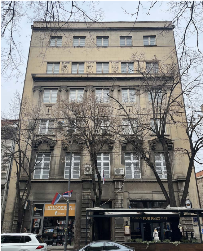
Сл. 2. Палаћа Индустијске коморе и Удружења београдских индустријалаца, изглед прочеља