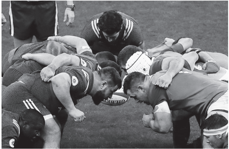
Poreklo naziva Scrum potiče iz ragbija, sporta u kom se igrači jednog tima zagrljeni guraju ka protivničkom timu (4, 43).

Scrum je jedna od agilnih metodologija razvoja softvera. Definicija agilnog data je u „Manifestu agilnog“ i podrazumeva niz vrednosti i principa koji daju smernice kako da odgovorimo na promene i kako da se borimo sa neizvesnošću. Agilne organizacije su u stanju da se brzo menjaju i prilagođavaju u okviru odgovora na promene, što je neophodno za poslovanje u dinamičnim uslovima. „Manifest agilnog“ (7, 1) definisali su 2001. godine softver developeri (Osnivačima ove metodologije smatraju se Jeff Sutherland i Ken Schwaber. Utemeljena je 90-ih godina 20. veka. 2001. godine, a oni su bili među sedamnaest lidera projekta razvoja softvera), sa željom da otkriju bolje mehanizme za razvoj softvera. Tada su istaknute četiri agilne vrednosti: