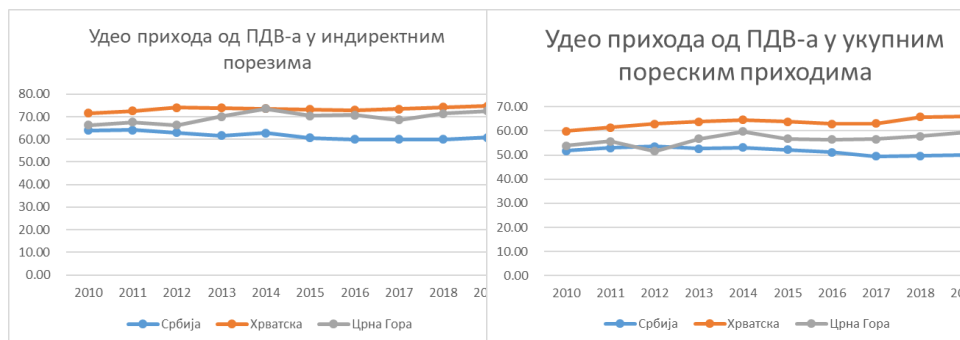
График 1.: Поређење удела прихода од ПДВ-а у индиректним порезима и укупним пореским приходима