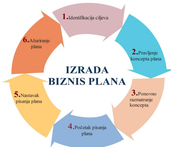
Slika 3. Ključni koraci u procesu izrade biznis plana

Napomena: Preuzeto od Ernst & Young business plan guide, od Siegel, E. S., and Siegel, E. S., 1987, New York: Wiley and Sons.