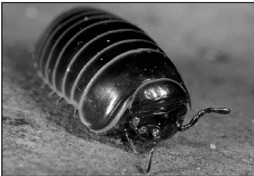
Слика 2. Изглед врсте Glomerismarginata

Нађен је само један примерак врсте Glomeris marginata . Ова врста распрострањена је широм Северозападне Европе, од Пољске до Скандинавије, од Шпаније до Италије (сл. 2).