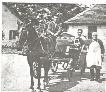
Fijaker bolnički, glavno prevozno sredstvo do 1967. godine

Posle borbe na Bukoviku, 24.jula 1944.godine, u Bolnici je lečen veliki broj četnika i drugog mobilisanog ljudstva u Ivankovačkom, Resavskom i Varvarinskom korpusu. Njih su dobrovoljno negovale članice ženskog ravnogorskog pokreta "ravnogorke", a takodje i druge čupričanke, po pozivu i naredbi su učestvovala u nezi ovih ranjenika, održavanju higijene, pripremanju hrane, pranju i peglanju veša, kao i drugim poslovima oko njihovog zbrinjavanja i lečenja. 2.septembra 1944.godine oko 11 sati od strane saveznika bombardovan je kolsko-pešački most na Moravi, ali je u tom bombardovanju stradala i bolnica. Interesantno je, da je zgrada Bolnice na krovu imala veliku oznaku crvenog krsta, te je po ratnim propisima i pravilima bila vidno označena kao sanitetska ustanova. Bolnica je za vreme okupacije nosila naziv "Bolnica", a u 1944.godini "Državna bolnica". 16