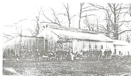
Baraka rezervne vojne bolnice na vašarištu u Čupriji, iz Srpsko – turskih ratova 1876. – 1878. godine, u kojoj je otvorena čuprijska Okružna bolnica 1881. godine