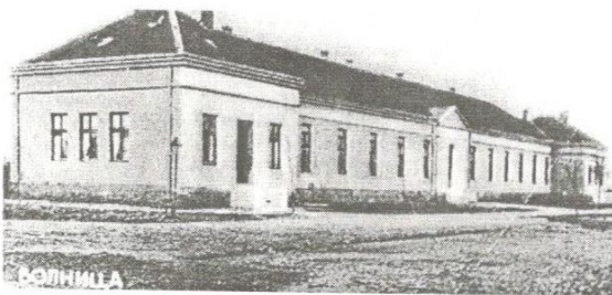
Zgrada okružne bolnice u Čupriji pri useljenju 1906. godine