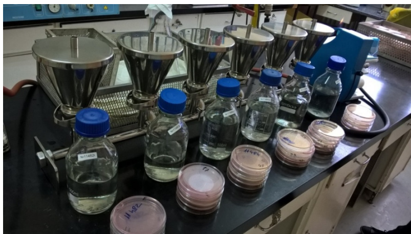
Слика 1. Апарат за филтрацију са узорцима воде и припремљеним хранљивим подлогама

Запремина испитиваних узорака воде је била 100 ml. У циљу брже и ефикасније филтрације, коришћена је вакуум пумпа. По обављеној филтрацији, мембрана се стерилно скида и поставља у Петријеву шољу на подлогу.