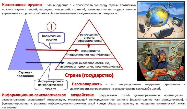
Слика 3. Супротстављеност у глобалном (светском) информационом пространству

Према истраживању Сверуског центра за испитивање јавног мњења, упркос чињеници да становници Руске Федерације у великој мери сматрају да су односи међу државама стабилни (45%), више од трећине испитаника стоји на становишту да се у свету ипак дешавају алармантни процеси, и да је ситуацију напета и непријатељска. Оптимиста, који мисле да је у свету све добронамерно и позитивно, је само 13%.