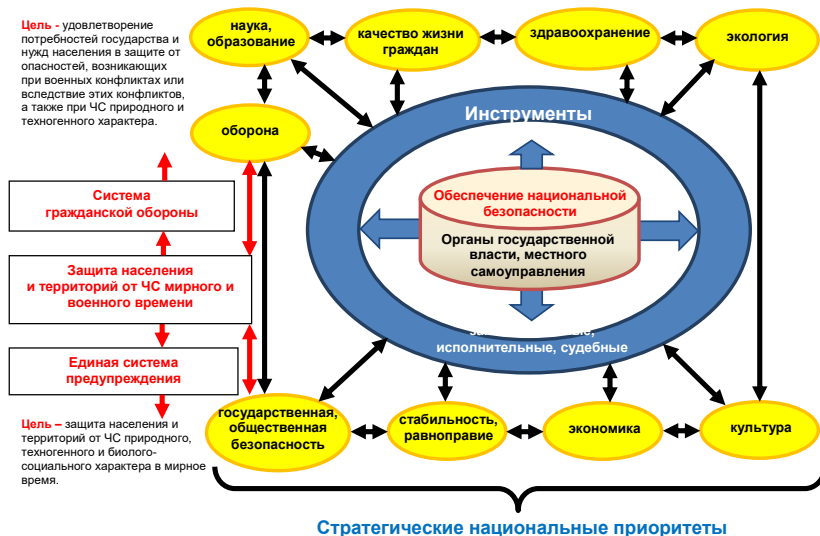
Слика 4. Систем обезбеђења националне безбедности државе

На бази горе истакнутих националних приоритета, функционишу два сложена система: систем за превенцију и ликвидацију последица ванредне ситуације, и цивилна одбрана. У неким земљама, формира се један – обједињен систем: цивилна заштита, који реализује обе наведене функције.