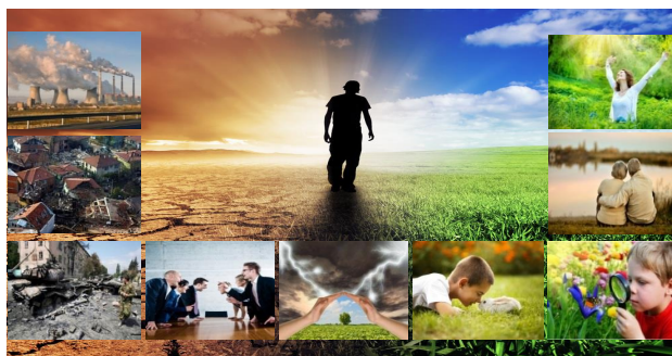
Слика 1. Глобални проблеми. Противречност односа природе и човека унутар друштва

Свака држава, у мањој или већој мери, брине о својој националној безбедности, под којом се подразумева стање заштитености личности, друштва и државе од спољних и унутрашњих угрожавања, обезбеђење остваривања уставних права и слобода грађана, достојан квалитет и ниво живота, очување суверености, независности, територијалне целовитости земље као и постојан социјално-економски развој (Указ председника РФ № 683, 2015).