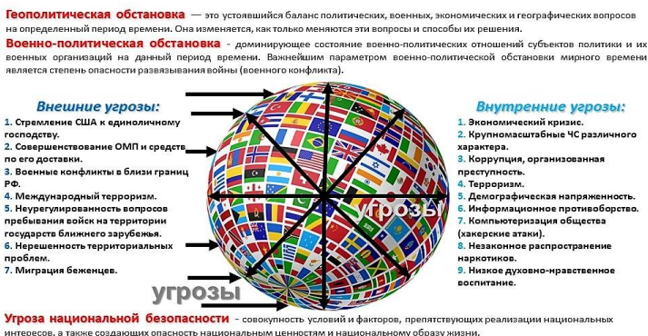
Слика 2. Спољне и унутрашње претње националној безбедности државе

За разлику од претњи које су увек изазване социјалним факторима и силама, опасности се, поред социјалног деловања, појављују и као резултат природних појава, елементарних непогода и катастрофа техногеног карактера.