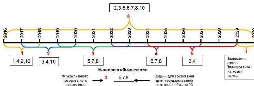
Слика 6. Предложени распоред приоритетних праваца на временској скали, на примеру реализације државне политике Руске Федерације у области цивилне одбране до 2030. године

Приказан редослед реализације приоритетних праваца треба распоредити на временској скали до рока њиховог извршења (цртеж б). Тиме ће се обезбедити благовремено планирање и правилан распоред финансијских средстава за сваку активност по годинама, као и квалитетна реализација свих задатака у тачно одређено време.