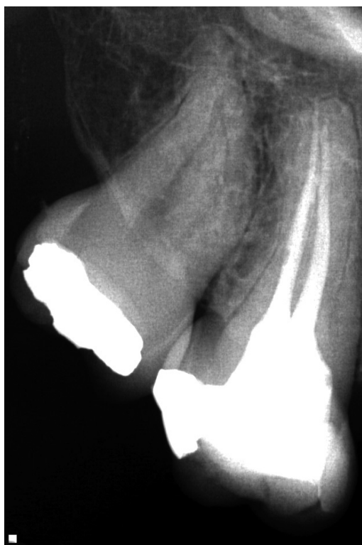
Slika 3. Definitivna opturacija zuba 17 sa dva korenska kanala

menta kanali su irigirani sa po 2 ml 1% rastvora NaOCl (Semikem, Sarajevo, BiH), a nakon završene celokupne hemomehaničke obrade, finalno irigirani sa 2 ml 17% rastvora EDTA (Pulpdent EDTA Solution; Pulpdent, Watertown, MA) u trajanju od dva minuta i posušeni sterilnim papirnim poenima (Dentsply Maillefer, Ballaigues, Švajcarska). Nakon toga, određeni su glavni gutaperka poeni i kanali su opturirani pastom Syntex (Syntex, Ceramed, Poljska) koristeći modifikovanu monokonu tehniku (Slika 3). S obzirom da kod pacijenta nije bila prisutna postoperativna osetljivost nakon endodontskog tretmana, upućen je na odeljenje Stomatološke protetike, Medicinskog fakulteta u Foči, kako bi se pristupilo izradi fiksne protetske nadoknade u gornjoj vilici.