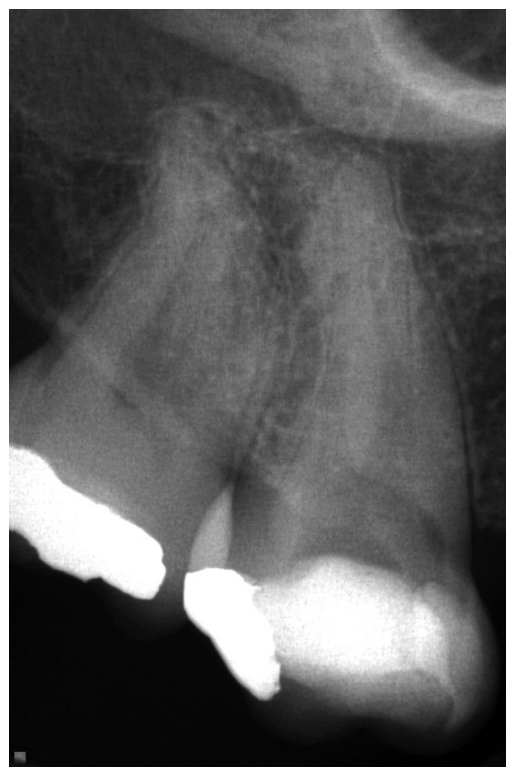
Slika 1. Dijagnostički radiogram zuba 17

Nakon ispitivanja inicijalne prohodnosti K turpijom # 10 (Dentsply Maillefer, Ballaigues, Švajcarska), uz pomoć apeks lokatora (Raypex