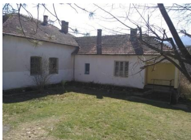
Слика I: Слика приказује спољашност сеоске школе у Округлици

Историја - Школа у Округлици саграђена је 1958. године, преко пута старе школе у којој није могао да се смести велики број ђака који је тада у селу живео, што сведочи о потпуно другачијем животу овог села у то време. Изградњу нове школе захтевао је велики број ученика, који су због недовољног простора похађали наставу у три смене. Учитељ који је радио од 1976. до 2006. године сећа се свог првог радног дана и осморо ученика у првом разреду, што говори о полаганом одливу становништва већ у то време услед индустријализације и сељења у оближњи Сврљиг (удаљеност 10 км). Имао је 25 до 30 ученика у комбинованом одељењу од 1. до 4. разреда. Тако је било све до 90-тих година 20. века. Тада креће даље опадање броја ученика, тако да се број ученика преполовио. Није било више сва четири разреда. Од 2003. године број ученика се нагло смањује, као и разреда. На крају свог дугогодишњег рада овај сада учитељ у пензији, сећа се, индивидуалног рада са једним учеником.