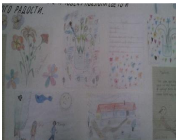
Слика III: Слика приказује ученичке радове на зидним новинама