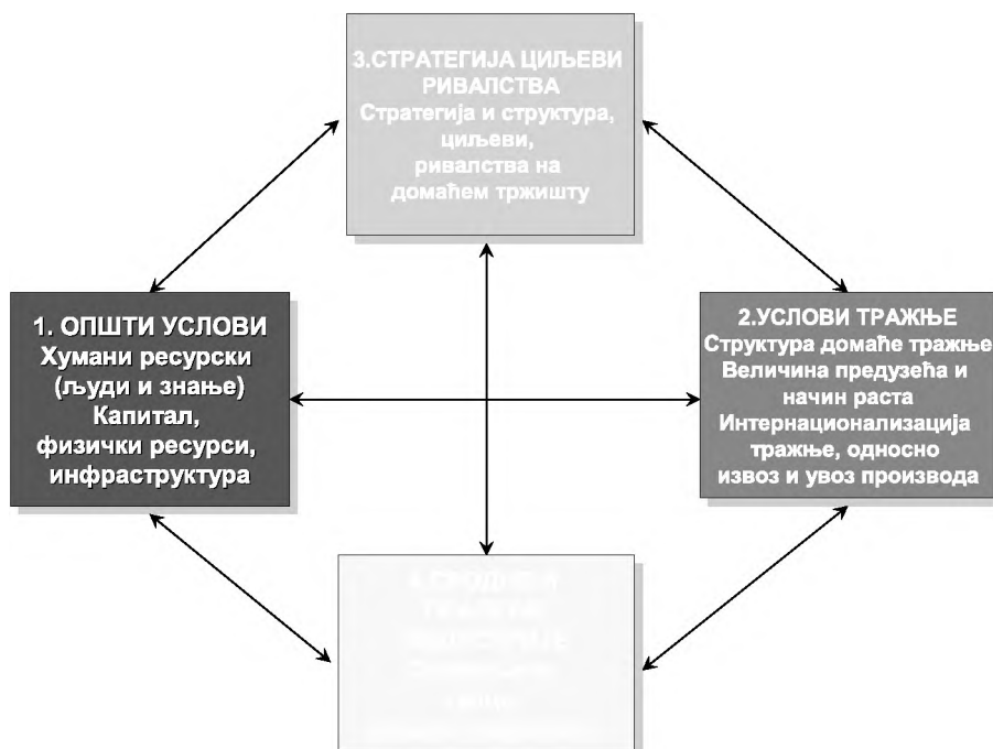
Сл. 1: Модел дијаманта 1 Porters diamond model

Методолошки оквир за анализу базиран је на моделу Портера (слика 1). Према Портеру, карактеристике окружења у коме фирме дјелују, су најважније за конкуретност и то: (1) општи услови, (2) стратегија фирми, структуре и ривалства међу фирмама; (3) услови тражње; (4) сродне и пратеће индустрије. Као посебан, пети фактор се наводи и држава, односно влада, која својом политиком и мјерама врши утицај на сва четири фактора. ( Конкурентност пољопривреде Србије, 2004 )