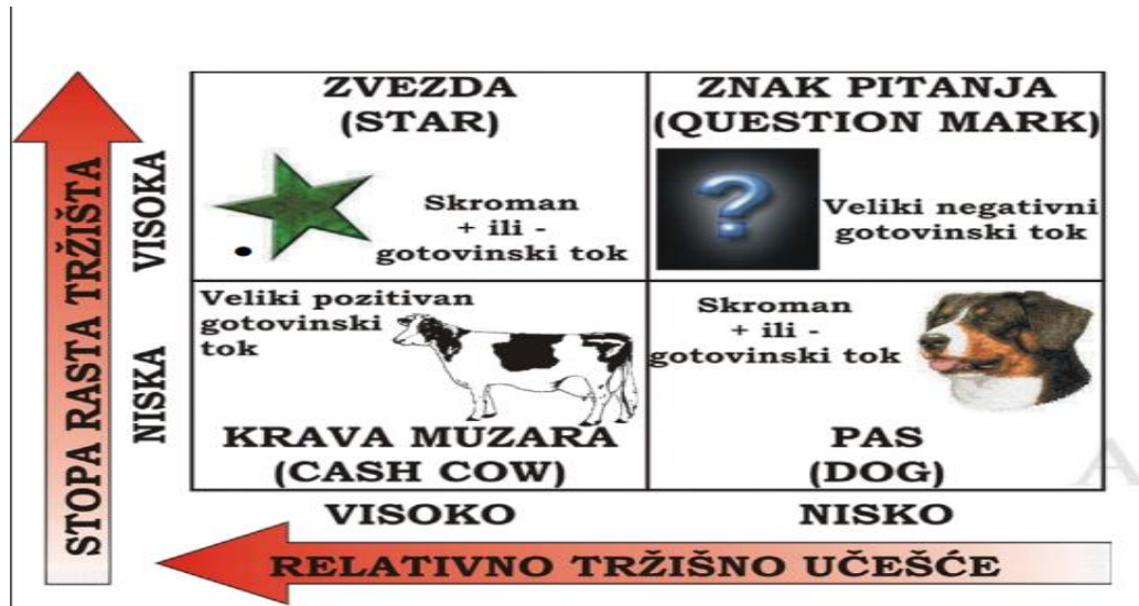
Slika 1. BCG matrica [12]

Preduzeće bi trebalo da eliminiše proizvode „pse“ a finansijska sredstva koja obezbeđuju proizvodi iz kvadranta „krava muzara“ usmeri ka najperspektivnijim „upitnicima“ da bi oni došli u strategijsku poziciju „zvezda“ koje obezbeđuje dugoročnu rentabilnost. [12]