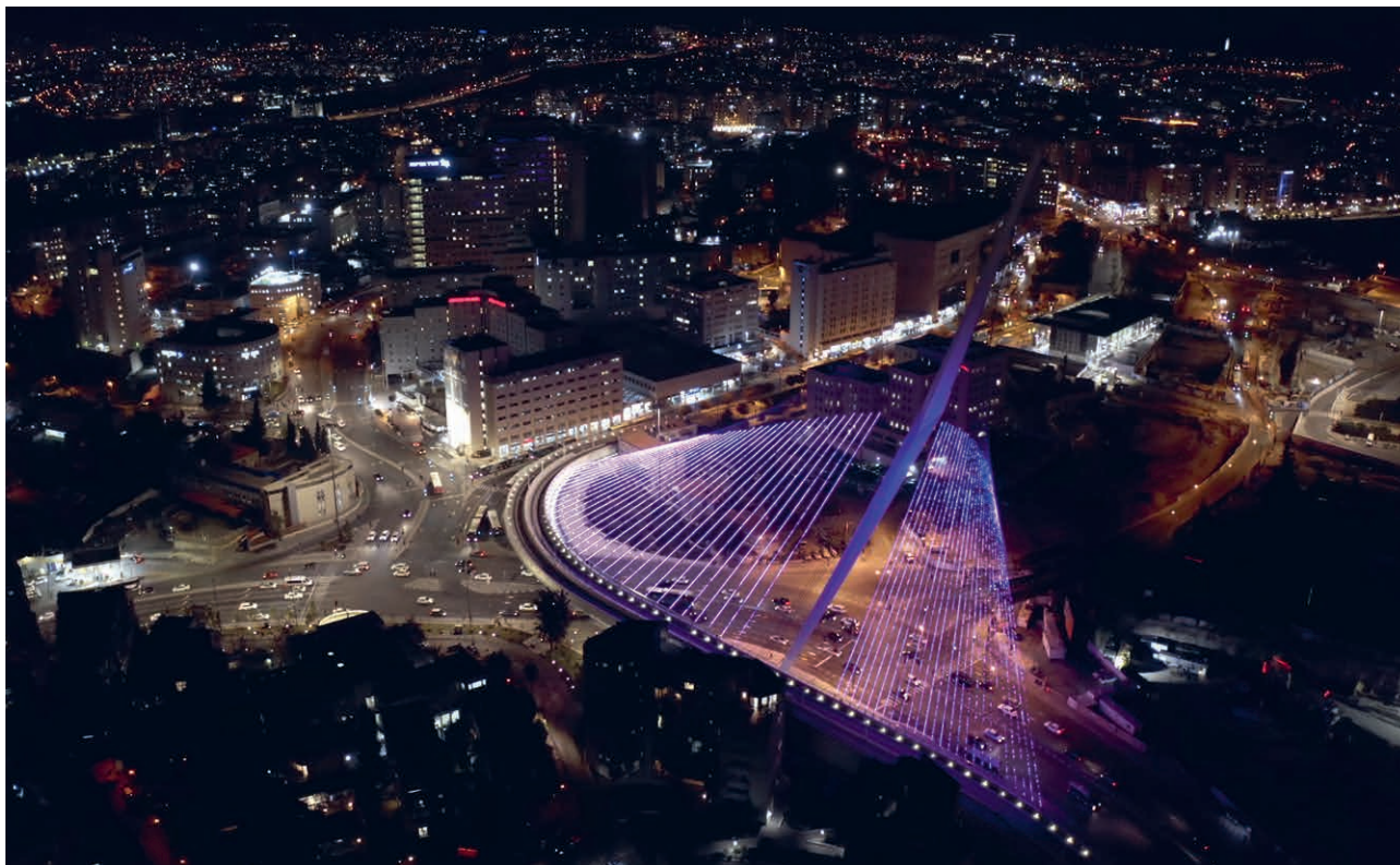
Ноћна панорама савременог Јерусалима