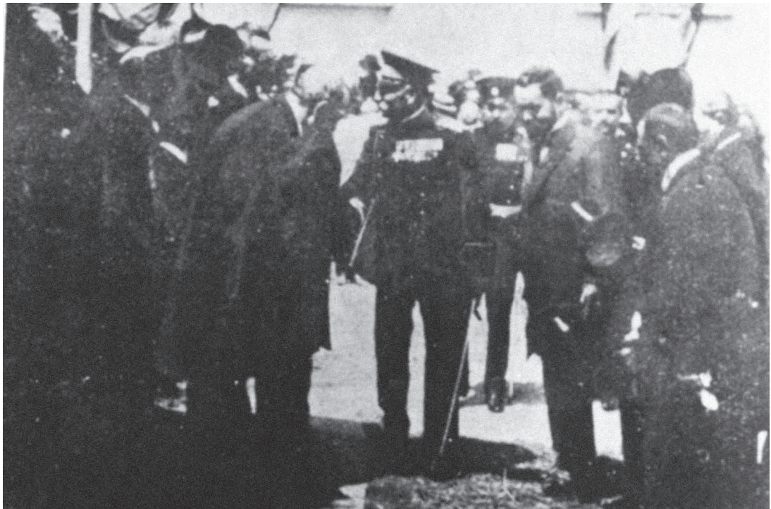
Полагање камена темељца београдске синагоге Бет Јисраел .