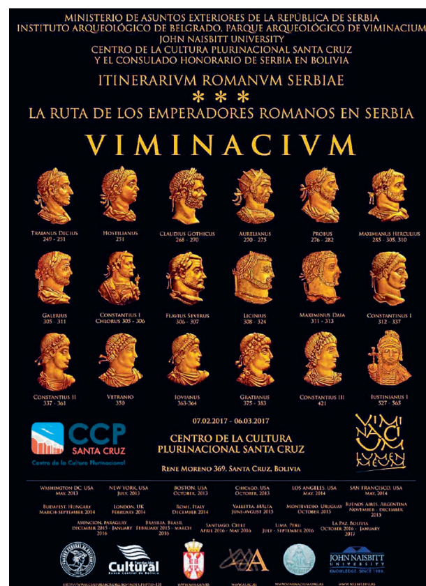
Слика 1 - Промотивни плакат са последње изложбе „Путеви римских императора у Србији“ приређене у Санта Круз де Сијери 2017. године [7]