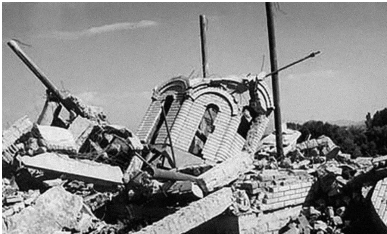
Слика 2 – Црква Свете Петке у селу Заскок код Урошевца