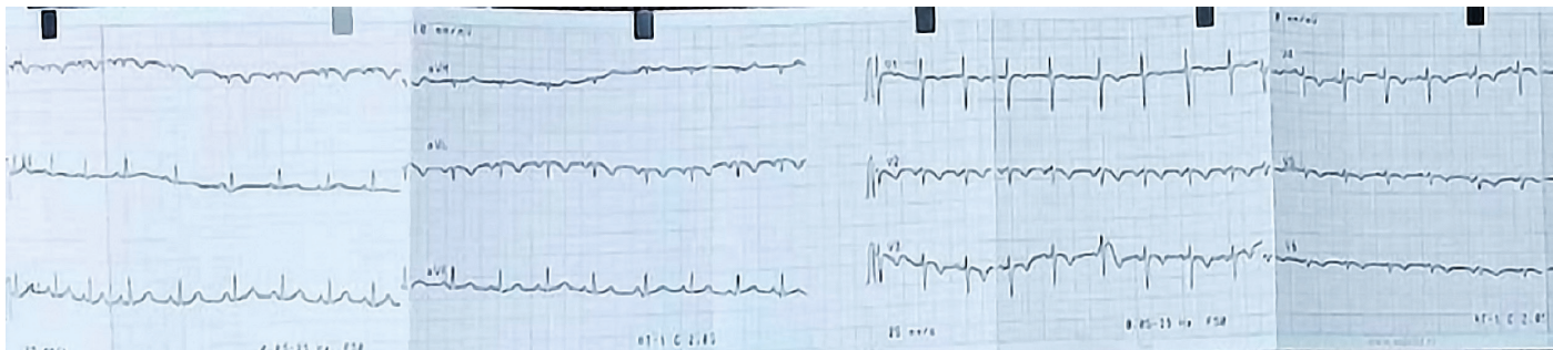
Слика 2а. 12-канални површински ЕКГ запис трогодишњег дечака са situs inversus totalis (прекордијалне електроде постављене на леву половину грудног коша): десна срчана осовина, негативан p талас, QRS комплекс и T талас у првом стандардном одводу, позитиван p талас у одводу aVR , негативан p талас и QRS комплекс у одводу aVL , негативни T таласи у прекордијалним одводима и прогресивно смањивање амплитуде R таласа у прекордијалним одводима од V1-V6

Figure 2a. 12-channel surface ECG of a 3-year-old boy with situs inversus totalis (precordial leads placed on the left half of the chest): right cardiac axis, negative p wave, QRS complex and T wave in the first standard lead, positive p wave in the aVR lead, negative p wave and QRS complex in the aVL lead, negative T waves in precordial leads, as well as progressive reduction of R wave amplitude in precordial leads from V1-V6