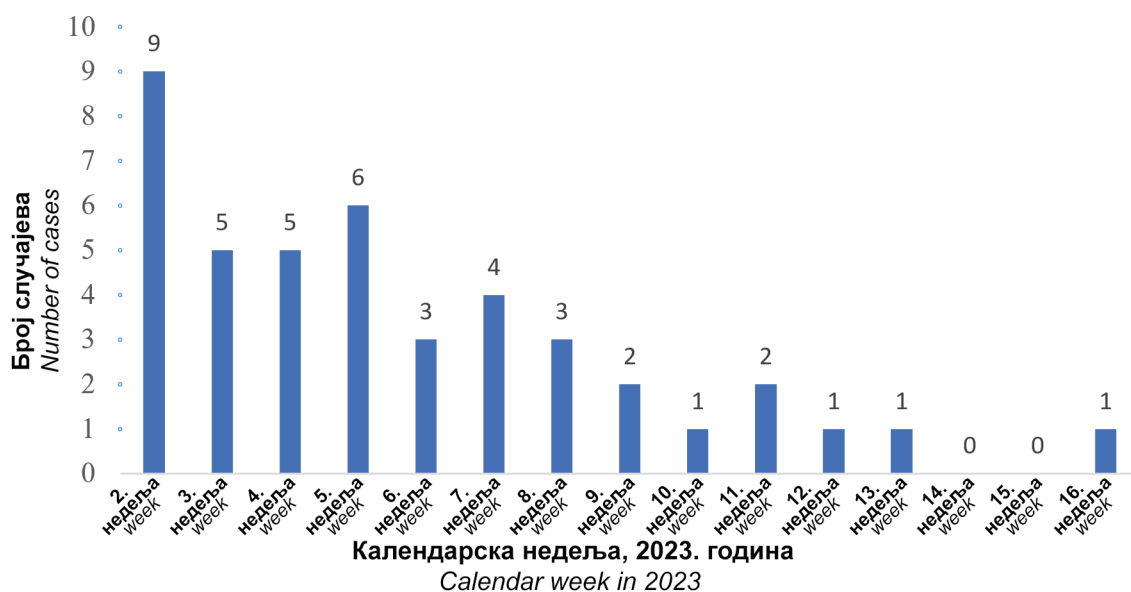
Chart 1. The number of reported cases of measles during the outbreak in the territory of the city of Smederevo per week in the period from January 10, 2023, to April 19, 2023

Од 43 оболеле особе њих 20 (46,5%) било је мушког, а 23 (53,5%) женског пола. Најмлађа оболела особа била је узраста четири месеца, а најстарија 49 година. Већина оболелих била је у узрастним групама од 1 до 4 године (19 тј. 44,2%) и од 20 до 49 година (14 тј. 32,6%). Највиша узрастно-специфична стопа инциденције регистрована је у узрасној групи млађих од 12 месеци (80,6 на 10.000 становника) и у узрасној групи од 1 до 4 године (50,5 на 10.000 становника). Број оболелих по узрастним групама и узрастно-специфичне стопе инциденције приказане су у табели 1.