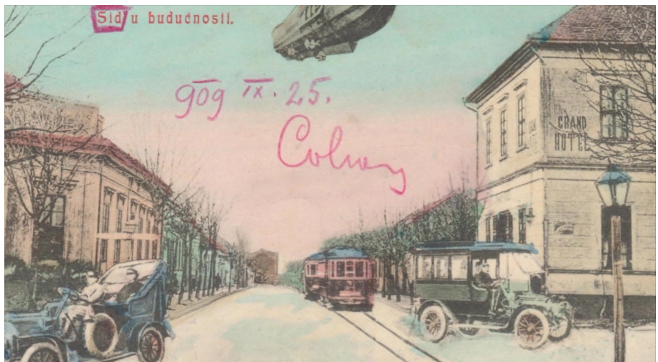
Сл. 2. Разгледница на којој се види „Гранд Хотел“ и улица у којој се налази кућа Густава Штурма, 20. век