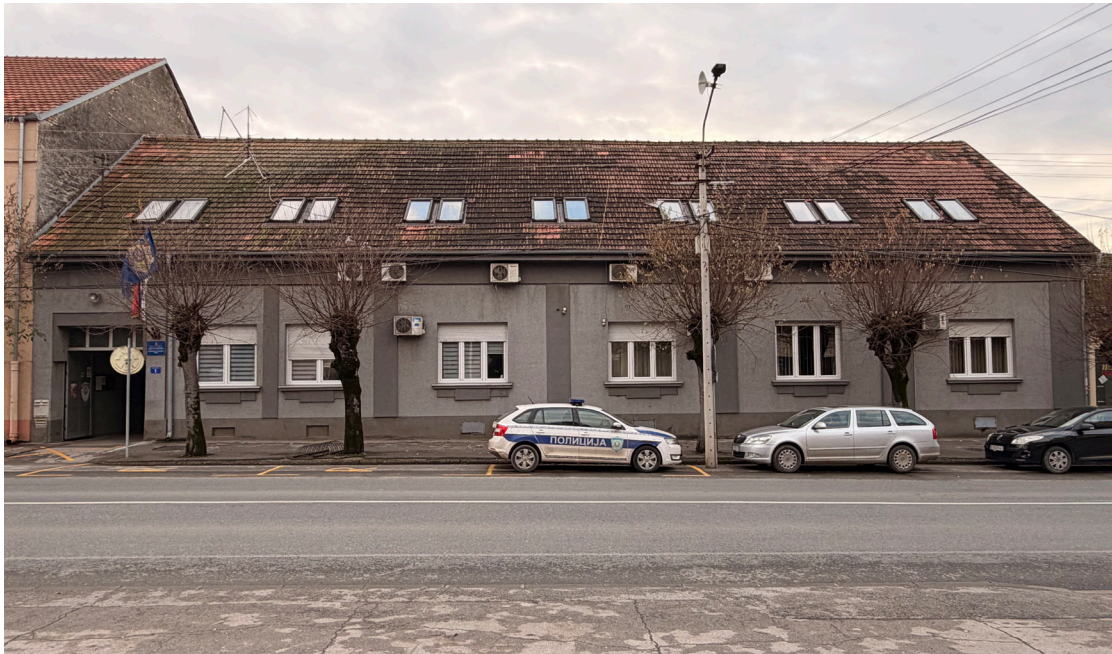
Сл. 4. Зграда Полицијске станице Шид, некада кућа Густава Штурма, 2025.