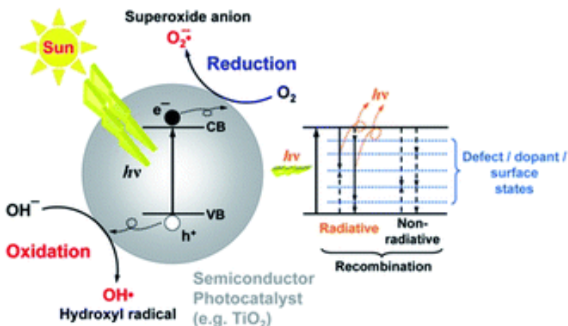
Слика 1. Шематски дијаграм фотокатализе [10] Figure 1. Schematic diagram of photocatalysis [10]

Механизам процеса фотокатализе је детаљно описан у неколико радова [5-9]. Укратко, приликом озрачивања површине фотокатализатора, долази до побуђивања електрона ( e^- ) у валенцијском слоју и њиховог преласка у проводни слој електронског омотача. На упражњеном месту, долази до генерисања позитивне шупљине ( h^+ ). Настали парови учествују у комплексним реакцијама оксидације и редукције присутних органских молекула у узорцима вода (слика 1).