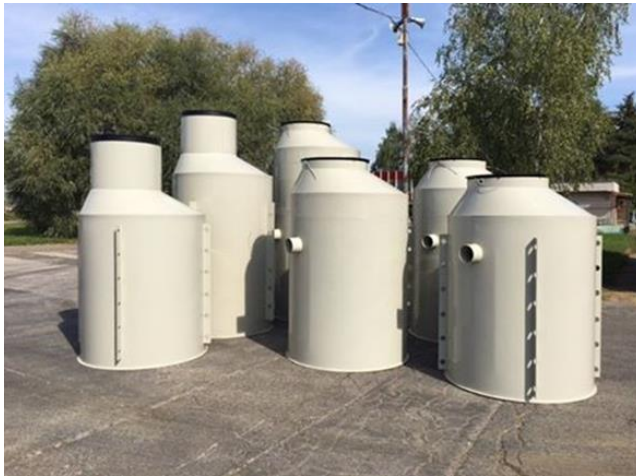
Слика 2. Савремена септичка јама (4) Figure 2. Figure 2. Modern septic tank (4)

У септичкој јами се одвија пречишћавање отпадне воде у анаеробним условима, са следећим просечним ефектима смањења полутаната у односу на њихов садржај у сировој (нетретираној) води: органске материје (БПК, ХПК) од 40-50% , укупне суспендоване материје око 60-80%, уља и масти око 70-80%, укупни азот до 50%. На слици 2 приказан је изглед типичне савремене једнокоморне септичке јама. (4)