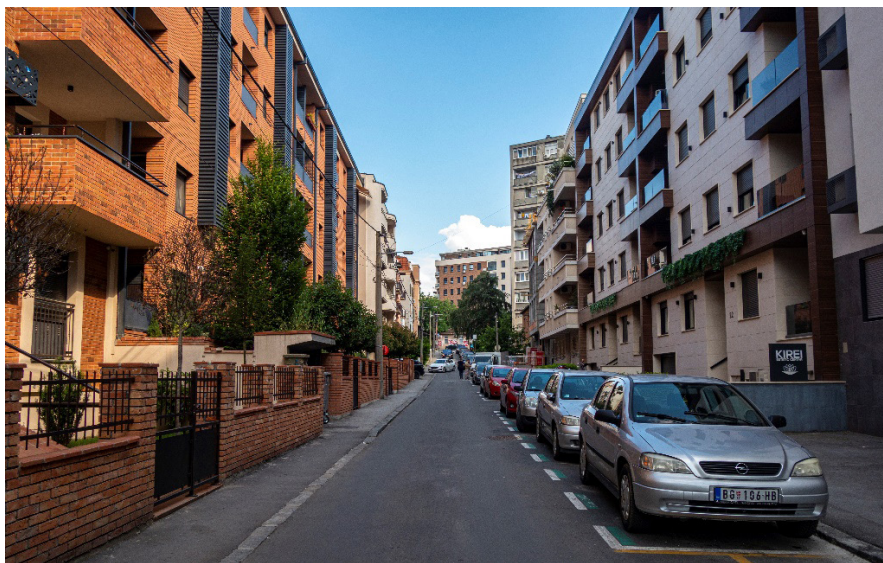
Slika 3. Subotička ulica, 2024. godina

P+4, koji, kada se uporede sa novoizgrađenim stambenim zgradama sa druge strane ulice, imaju u potpunosti zadržanu formu predbašte sa ogradom kao značajnim elementom originalnog urbanizma naselja (Slika 3). 20