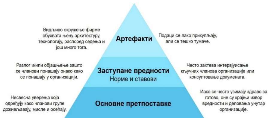
Слика 3. Три нивоа организационе културе (према Шеину [2])

Карактеристике добре безбедносне културе је теже одредити, а оне често укључују ставке попут: отвореност у вези безбедности и циљева безбедности, спремност да се чују лоше вести, нагласак на томе шта је неопходно урадити за повећање безбедности, а не само за придржавање прописа или производњу много папирологије и веровања да је безбедност важна у постизању циљева организације.