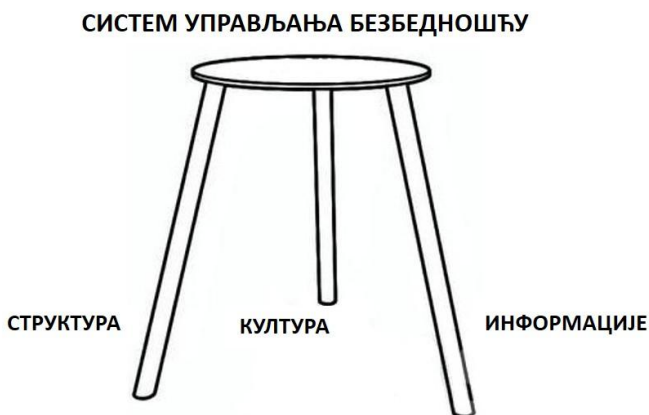
Слика 2. Троножац система управљања ефикасношћу (безбедношћу)

Информациони систем безбедности пружа информације неопходне да се сачини успешна структура управљања за постизање жељене безбедносне културе.