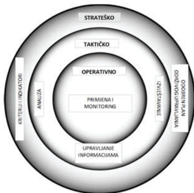
Slika 2. Od strateškog do operativnog - „ugniježđeni“ interaktivni nivoi hijerarhijskog planiranja (Jeakins et al. 2004; 2006).

Vrsta i stepen detaljisanja indikatora i njihove granice su različiti u zavisnosti od hijerarhijskog nivoa planiranja, stepena razvoja šumarstva, primjene međunarodnih standarda i područja na koji se planovi odnose. Kriterijumi i indikatori održivog upravljanja šumama koriste se za obezbeđivanje strateških i sistematskih elemenata za procjenu upravljanja šumama, izradu planova kao i za podsticanje razvoja adaptivnih programa upravljanja (Prabhu et al. 1999; Jeakins et al., 2006, Medarević, 2006). Indikatori su istovremeno i korisni jer daju ciljne vrijednosti (pragove) prema kojima se planira upravljanje šumama a koriste u svim fazama (strateško, taktičko i operativno) hijerarhijskog interaktivnog planiranja (šema 2).