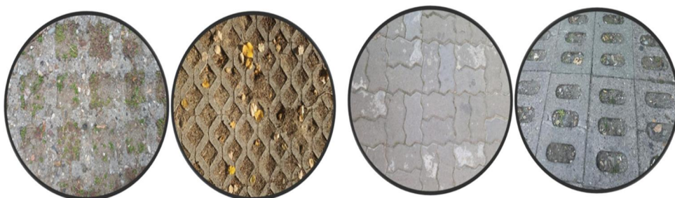
Slika 2. Najčešći tipovi poroznih popločanja Figure 2. The most common types of porous pavements

U okviru saobraćajne infrastrukture, primena principa održivog razvoja zahteva transformaciju tradicionalnih, energetski zahtevnih procedura izgradnje u cilju obnavljanja prirodne sposobnosti površina da apsorbiraju kišnicu. Jedno od efikasnih rešenja koje se primenjuje globalno je uvođenje poroznih popločanja u urbanim sredinama. Najčešći tipovi poroznih popločanja su: porozni asfalt, betonske raster ploče, porozni beton i porozne behaton ploče (slika 2). Razlika između ovih proizvoda ogleda se u mehanizmu propustljivosti: neki materijali sadrže pore sposobne da transportuju značajne količine vode, dok su drugi postavljeni tako da kišnica prolazi kroz prostore između elemenata popločavanja [7, 8, 9, 13].