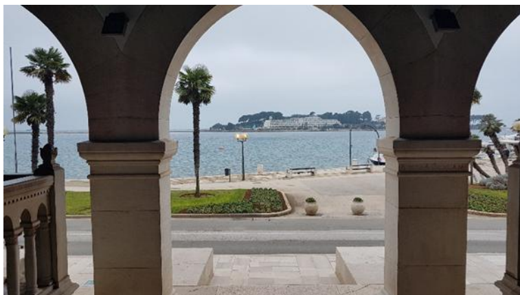
Slika 2. Poreč i otok sv. Nikola

Središnji dio Poreča, uključujući staru jezgru i otok Sv. Nikola, (Sl. 2) predviđen je za urbani razvoj, uz zaštitu kulturne baštine – Eufrazijevu baziliku, palače, ulice i trgove. Obalni pojas gotovo je u potpunosti turistički razvijen. Generalni urbanistički plan grada Poreča jasno razlikuje stambene, poljoprivredne, rekreacijske i turističke zone. Crvena boja, (T) na planu, označava turističke komplekse uz obalu, dok se stambene zone sve više povlače prema unutrašnjosti. Planirane građevinske zone uglavnom su smještene uz obalu i povezane s turističkim širenjem.