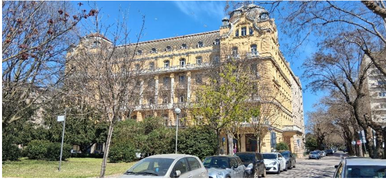
Slika 3. Pula i hotel Riviera