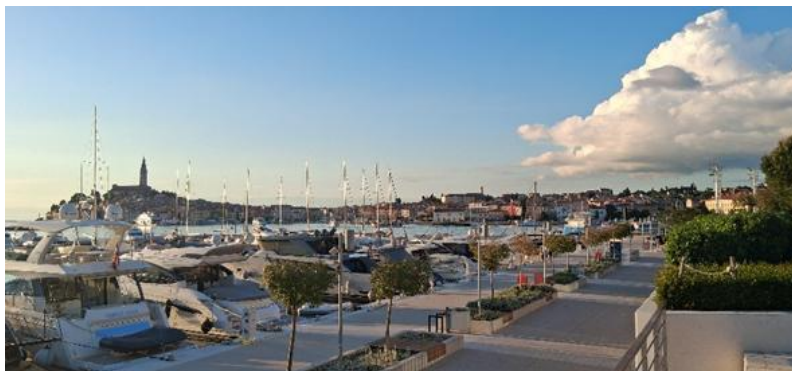
Slika 2. Rovinj - ACI marina Rovinj u turističkoj zoni Monte Mulini

Rovinj je prerastao prostorno širenje iz srednjovjekovne jezgre u grad pod snažnim utjecajem turizma. Novi kvartovi i hotelski kapaciteti razvili su se prema kopnu i uz obalu, a povijesna jezgra je prenamijenjena u turističke sadržaje. Potražnja za zemljištem i pretvaranje tradicionalnih obiteljskih kuća u apartmane za odmor jača kontinuirano pritisak na prostor, unatoč planovima koji ograničavaju nove građevinske zone i štite zelene površine. Masovni turizam, uz ostalo, izaziva i sezonske prometne gužve i opterećenje javne ulične vodovodne i kanalizacijske mreže. Grad je na dodatna opterećenja reagirao s odlukama o uvođenju pješačkih zona, (Sl. 1) „shuttle“ servisima, biciklističkim i javnim prijevozom te modernizacijom komunalne infrastrukture (vodoopskrba, odvodnja, elektroenergetika), čime je poboljšana kvaliteta života i održivost turističkog razvoja.